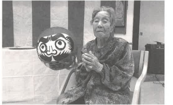
目入れをしたダルマと記念撮影