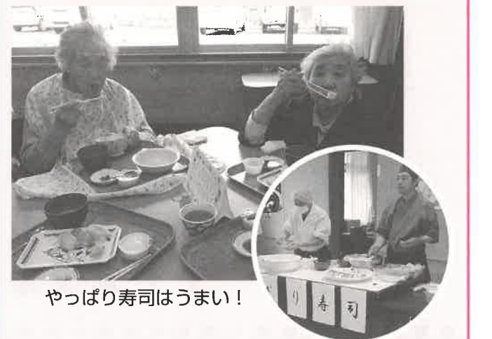
やっぱり寿司はうまい!

11月28日のお昼、ぶなの園で恒例の寿司バイキングが行われました。この日を楽しみにしている方も多く、新鮮なネタが並び職人さんが握り始めると、身を乗り出して見つめる姿がありました。まぐろ、いくら、サーモン、えび、うに、他にも豪華な海の幸がズラリ。待ちに待ったお寿司を味わって、「最高にうめがった」、「腹いっぱいだけどまだ食べたい」など、満足の声をいただくことができました。たくさんの笑顔を見ることができて、職員も大満足です。