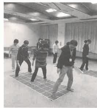
様々なパターンでステップ

西和賀町が実施している健康教室のスクエアステップ講座が12月18日、ぶなの園の交流スペースを会場に行なわれました。スクエアステップとはマス目の付いたマットを使用して、決められたパターンでステップするエクササイズ。指導員講習を修了したやすらぎ会職員が講師を務め、多くの町民の皆さんに参加していただきました。単純そうに見えるステップも、いざ