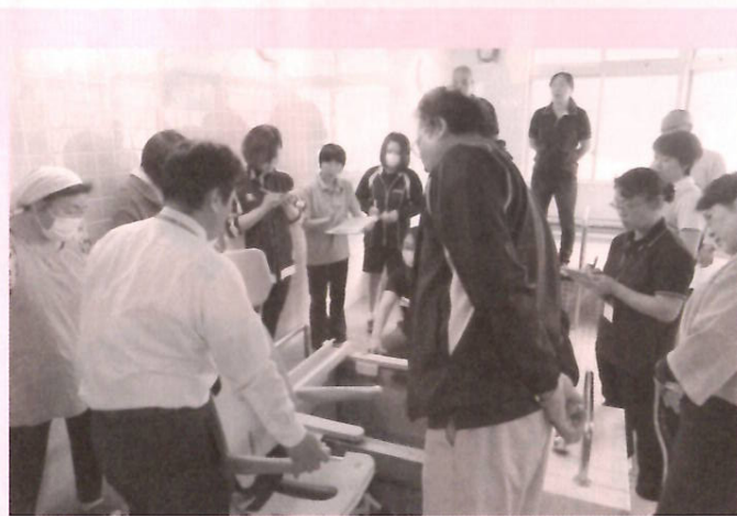
正しい使用方法をしっかりと確認

法をしっかりと教わりました。実際に職員同士で模擬介助を試みたところ、介助される側の不安や不快感は非常に少なく、さらに介助する職員の負担も大きく軽減されました。課題となっている腰痛予防効果の期待大です。この機器を大切に使用しながら、入浴が利用者の皆さんにとって最高のリラクスタイムになるよう今後も努めてまいります。