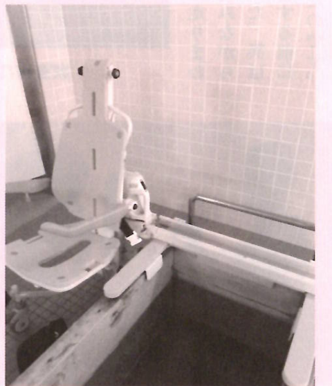
導入したリフト付きキャリー

ぶなの園浴室に、この4月リフト付きシャワーキャリーが2台導入されました。歩行困難な方が浴室内で使用できる車イスのような形で、ひのき浴槽に設置したレールを使用し、座ったままの状態でも湯船にも浸かることができます。利用者の皆さんに安全かつ快適に入浴を楽しんでいただくことが目的であり、まずはメーカー担当者から全介護職員で正しい使用方法