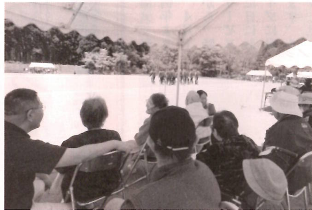
五月晴れの気持ちよい運動会でした

5月14日に開催された沢内中学校運動会はバッチリ晴天、ぶなの園応援団も張りきって参加させていただきました。小学校や保育所の運動会にも毎年出かけておりますが、中学生は大人と変わらない体格なので迫力満点、綱引きはこちらも力が入るくらいに見応え十分でした。デカパンレースなどユニークな種目もあり、見ているだけでなく出場したくなった方もいたかも…。生徒たちからみなぎるパワーをもらい、元気に帰ってきました。