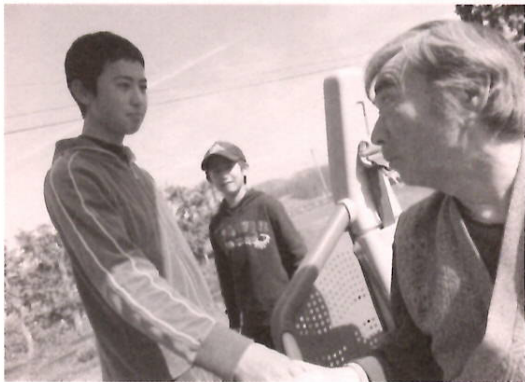
堅い絆を感じる父と子の握手

く、桜だけでなく元気に走りまわ る子どもたちの姿も微笑みながら 眺めていた皆さんでした。実は ファミリールランドに到着する前 にも、感動の場面があったのです。