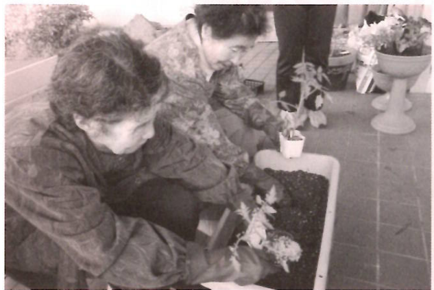
土に触れると心が落ちつきます

デイサービスぶなの園で毎年行っているプランターでの植物栽培。利用者の方々と職員で苗や土を買いに行き、5月13日に苗植えをしました。今年はキュウリ、ミニトマト、桃太郎トマト、黒皮小玉スイカの4品目と、ベチュニア、ミニ百日草の花の苗。昔とった杵柄で、楽しくおしゃべりをしながらも手際よく植えられていき、プランターにきれいに並んだ苗は生き生きと見えました。利用者の皆さんからは「きれいだなあ」「めんこい苗っこだなあ」の声。立派に膨らんでいく野菜たちの成長を想像しながら、優しいまなざしで見つめておりました。