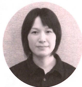
〔特養ぶなの園介護職員〕