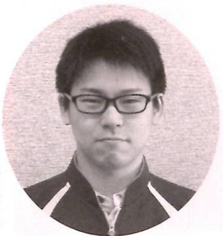
〔特養ぶなの園介護職員〕