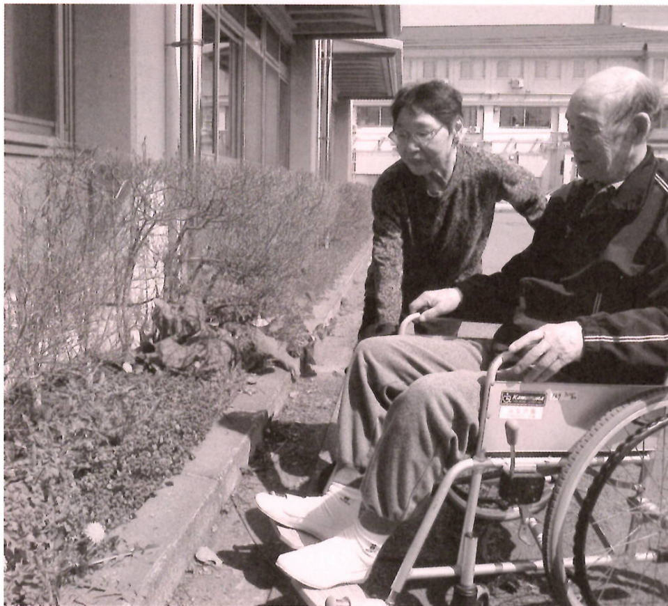
春の草花を見るとつい話しかけたくなりますよね♪