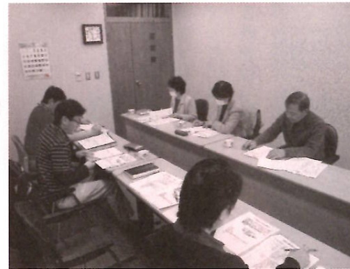
今年度1回目の委員会の様子

から委嘱状が交付されました。委員会を設置しているから苦情受付の体制ができていくというものではありません。大事なことは、利用されている方々が声をしやすい環境づくりであり、その声を法人としてしっかりと受け対応を検討していくことです。信頼される法人であるために努力してまいりますので、第三者委員にでも、職員にでも、あるいは地域の方にも、お気付きの点は遠慮なくお申し出ください。