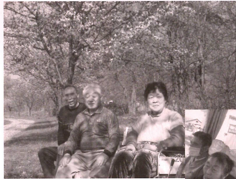
桜並木をバックに (かたくりの園)