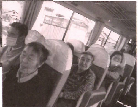
車内はとってもにぎやか (特養ぶなの園)

ドライブシーズン到来! 特養ぶなの園では4月30日に利用者9名で出かけました。鍵沢、長瀬野など東環線を中心にゆっくりとドライブ。鮮やかな桜が見えるたびに利用者の皆さんの歓声が響きました。デイサービスぶなの園やかたくりの園でも4月下旬から5月上旬にかけて、町内の桜の名所に出発。かたくりの園では「雪どけドライブ」と称して計画していましたが、予想外に桜の開花が早く「お花見ドライブ」に変更です。車内に吹き込む風も気持ちいいドライブでした。