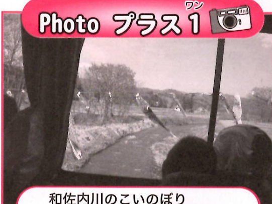
和佐内川のこいのぼり ～ドライブ車内から～