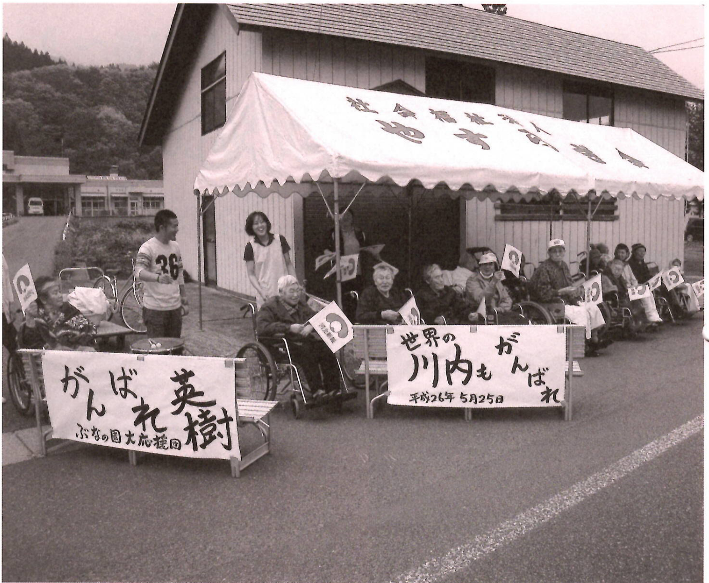
みんながんばれ～！（P8をご覧ください）