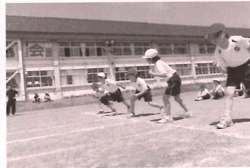
位置について、ヨーイ…