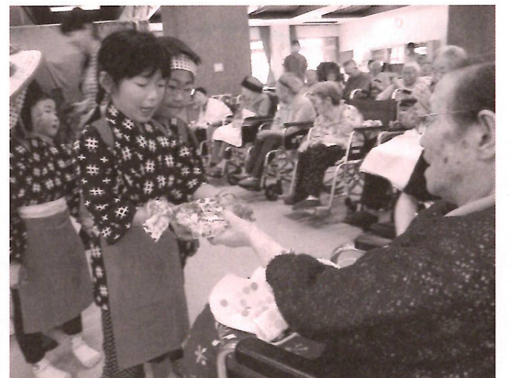
子どもたちにささやかなプレゼント