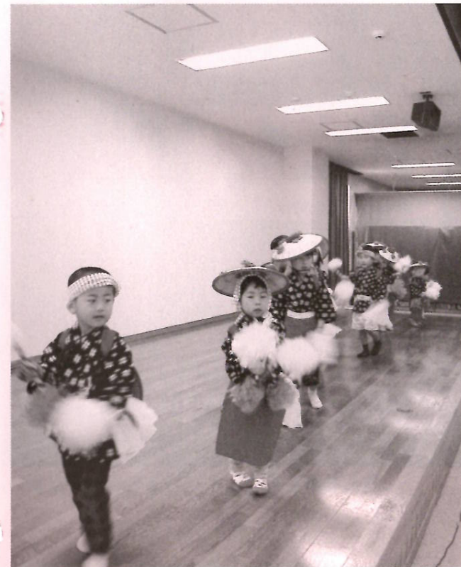
田植え踊りで豊作祈願

今年も無事田植えを終えることが出来たことを神様に感謝しながら宴を催す、それが「さなぶり」です。ぶなの園住民の皆さんは、若いころ何日もかけて自分の手で田植えをした方々、きつと当時は盛大にさなぶりを行なっていたことと思います。その雰囲気も少しでも思い出してもらおうと、6月11日にぶなの園でさなぶり祭りを開催しました。午前中は川舟保育所の子どもたちも元気に田植え踊りや歌を披露していただきました。衣装も振り付けもバッチリ決まっています。素晴らしい一言。一人ずつ自己紹介をしてもらったあとは、ゆつくりと握手をしながら触れ合いました。ぶなの園からのプレゼントとしてお菓子と住民手作りの折り鶴を用意していたのですが、子どもたちからもかわいい絵のついたハンガーとタオルをいただき、ほのぼのとしたプレゼント交換となりました。お昼のさなぶり定食もおいしくて、お腹と心が満たされたさなぶり祭りでした。