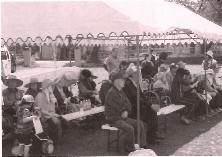
応援団もすごい迫力だなあ～