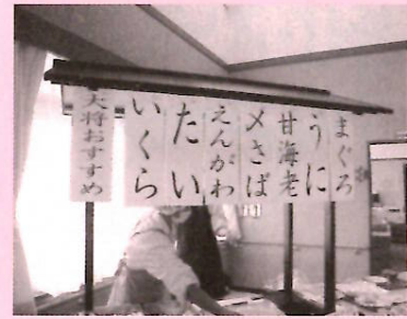
おすすめ全部食べたい