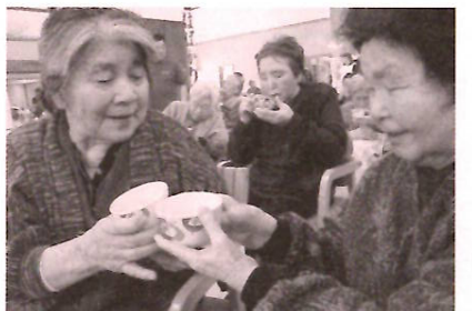
今年もお互い健康で!