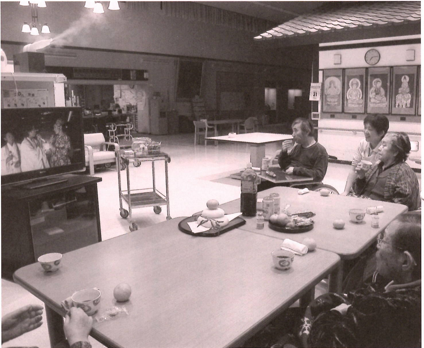
大みそかはやっぱりコレ！（P8をご覧ください）