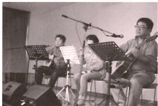
心地よい音楽を奏でる「レベル5」の皆さん