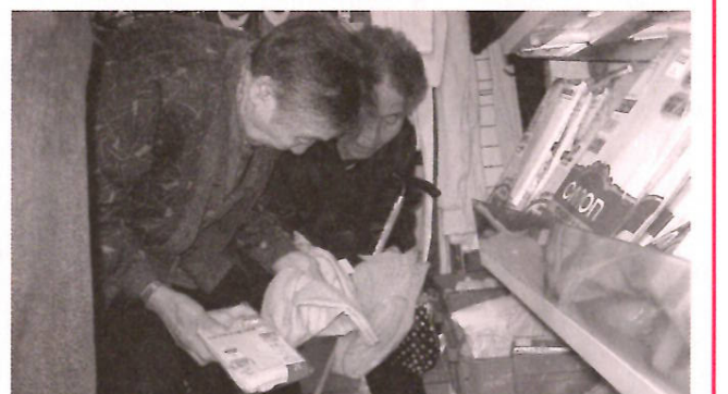
いろいろあって迷っちゃう