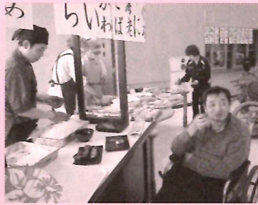
すしは握りたてがイチバン

大好評につき今年も業者の職人さんが握る寿司バイキングを11月29日に開催しました。寿司ネタはまぐろ、はまち、うに、いくらなど多彩で鮮度も抜群。海老の味噌汁も付いて、本物のお寿司屋さんと変わらない味と雰囲気でした。人を幸せな気持ちにしてくれるお寿司、ごちそうさまでした。