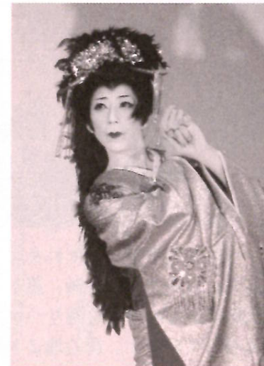
「橋本舞踊劇団」のきらびやかな舞い

ました。お忙しいなか足を運んでくださった皆様、ボランティア等でご協力いただいた皆様に感謝申し上げます。ありがとうございました。