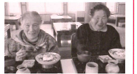
それではいただきます!

らび餅をお土産として購入している方もおりました。なんと、いっても、お店へ向かう車中の会話が盛り上がること(笑)。短い時間ではありましたが、利用者さんも職員も一緒に楽しんだ旅でした。