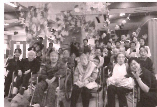
ふれあいアート完成

ました。お忙しいなか足を運んでくださった皆様、ボランティア等でご協力いただいた皆様に感謝申し上げます。ありがとうございました。