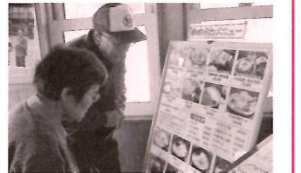
どれもおいしそうだなあ

お店ではラーメンやそば、パスタにカレーなど自分で選んで注文。楽しくお話ししながらゆつくりと食事をし、お腹いっぱいになった後は買い物です。冬に備えて電気毛布を購入したり、長靴や厚めの衣類を手取る方が多いようでした。中には孫へキャラクター柄のタオルや、家族にわ