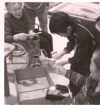
手作りの釣りゲーム