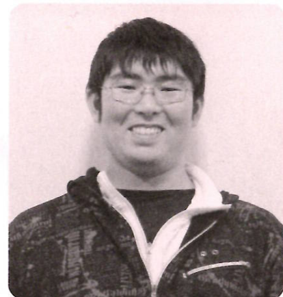
平成23年10月より勤務