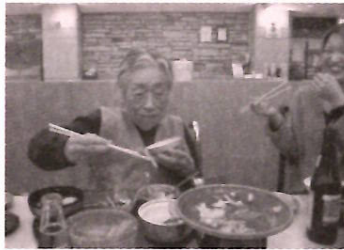
全部食べれるかしら♪