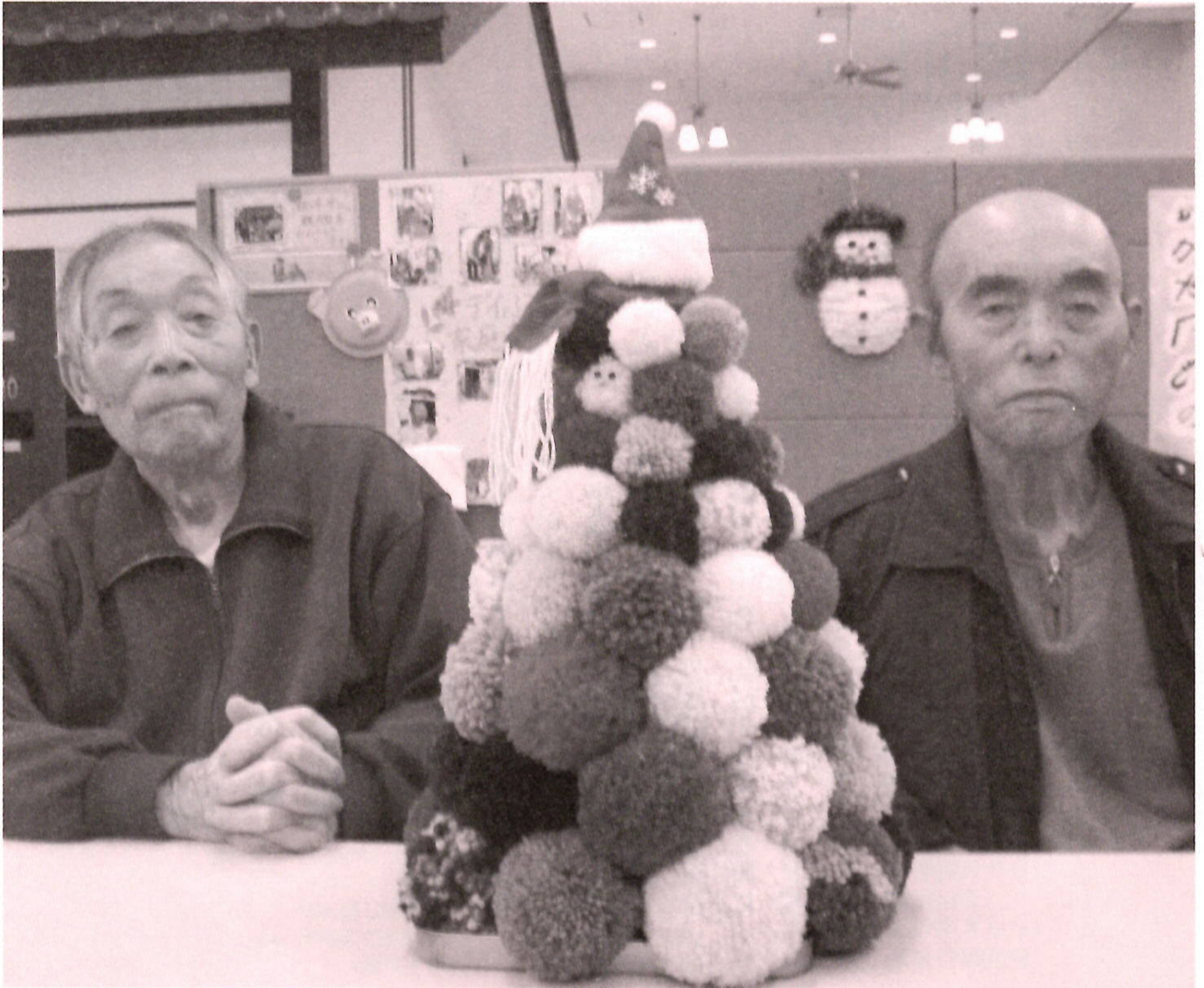
手づくりツリー、ステキでしょ♪（詳細はP8）