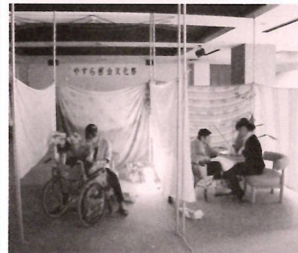
落ちついた空間でマッサージ