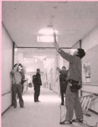
消防署員立会で作動確認

12月22日には消防署による検査が行なわれ、その安全性が確認されました。広い施設内のどこで火災が発生しても装置が作動する仕組みになっており、万が一の時には大きな力を発揮してくれるはず。勿論、装置を作動させることがないよう「火の用心」に一層努めてまいります。