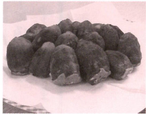
おいしそうにできあがりました

かたくりの園の初冬の風物詩、干し柿づくりが今年も行われました。利用者の皆さんに皮むき、紐つけなど、リハビリも兼ねて作業をお願いいたします。今年は男性陣の参加が多く、140個あまりの渋柿で、あつという間にオレンジ色のカーテンが出来上がりました。待つことおよそ一ヵ月、オレンジ色に輝いていたあの渋柿が、甘みを付けて少しづつ濃い飴色に変わっていきます。12月に入り寒さが厳しくなったころ、「もーいんじやないの」の調理員さんの声で、職員が出来ばえを確認しました。昨年より少し小ぶりの柿ですが、出来ばえは上々。「大丈夫だな！」今年もできたね。次の日から、利用者の皆さんに今年の出ればえを堪能していただきました。「やっぱり、我だでつぐれば、うめえもんだ！」利用者の皆さんが満足そうに干し柿を召し上がっているのを確認してほっと胸をな