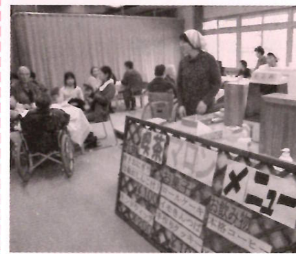
喫茶マロンは大にぎわい