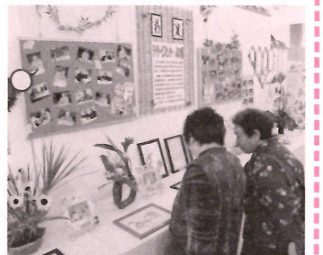
心をこめた作品の数々