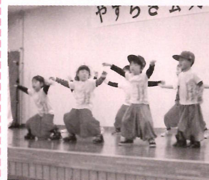
ちっちゃいけどカッコイイ