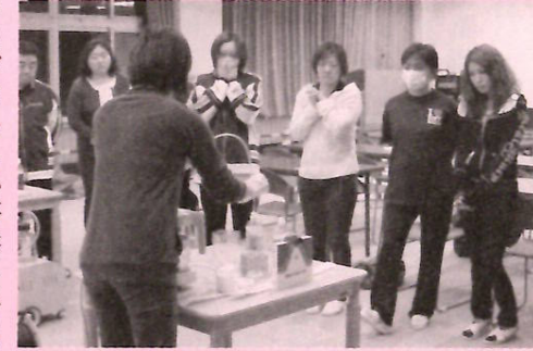
吸引の指導を受ける介護職員

これまで、原則的に医師や看護職員にしか認められていなかった痰吸引等の医療処置の一部が、平成24年4月から介護職員にも認められることになりました。ただし、指導者講習を修了した看護職員から一定の研修を受けること、安全に処置ができる環境を整えることが前提となります。