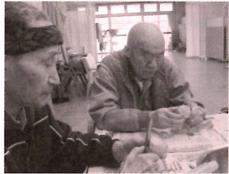
指先に全神経を集中