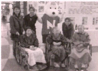
旅の記念に(ふるさと村にて)

は「はば ぎ脱ぎさ ねばねえ 」など 大盛り上 がりで、 本場に楽 しい旅で した。