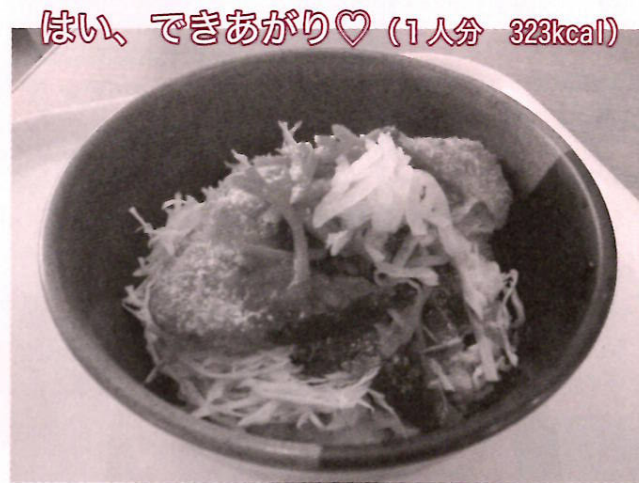
はい、できあがり♡ (1人分 323kcal)

マヨネーズをかけてもいいし、炒めた玉ねぎを添えるとさらにおいしくなります。ソースは少し甘めに作ってもOK。また大人向けに中濃ソースにウスターソースを混ぜるのもグッドです！