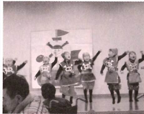
新町保育所の元気なステージ

12月22日、クリスマスと忘年会をくっつけて賑やかな時間を過ごしました。新町保育所の子どもたちのステージをはじめ、ひまわり会、太田婦人会の皆様をのりを楽しみながら飲んだり食べたり。年の瀬はやはりこうでなくちゃ。実は12月中旬に川舟保育所、せんだん保育所の子どもたちもぶなの園でそれぞれかわいいのりを見せてくれたんです。元気いっぱいの姿を見て、ぶなの園住民も幸せいっぱいの気分でした。