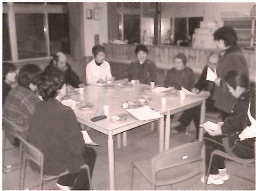
和やかな雰囲気懇談会

参加されたみなさんも、はじめは少しお話が途切れがちで静かな感じでしたが、職員には見えない自宅での様子、普段から感じていることや悩んでいることなど、話題が多くなるに連れて声も増えていくようでした。中には、実際にデイサービスを利用しているこ