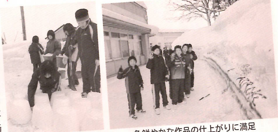
バケツで灯ろうづくり