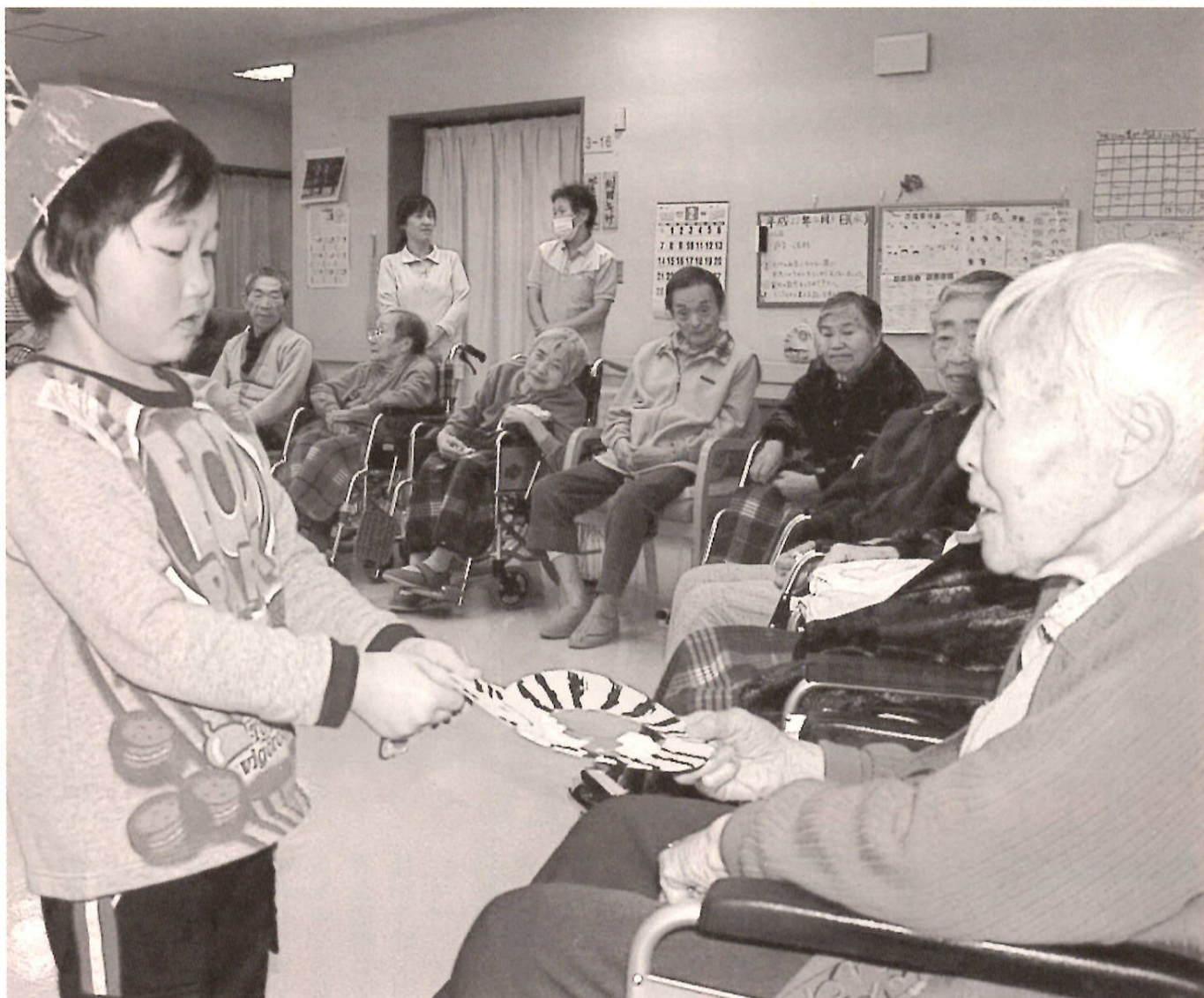
めんこい鬼からのプレゼント（詳細はP4、P8）