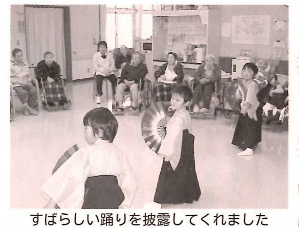
すばらしい踊りを披露してくれました