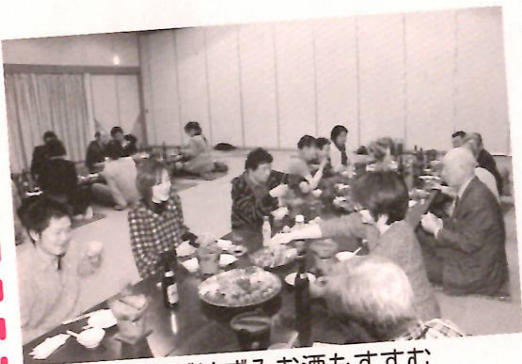
会話がはずみお酒もすすむ

となりました。また、数え切れないほどの灯ろうもきれいに並び、スプレーで独創的に色付けされたものも。そして何より、寒さを感じさせず楽しそうに制作する姿が微笑ましく、住民の皆さんも目を細めて見守っていました。沢内中学校の生徒の皆さん、先