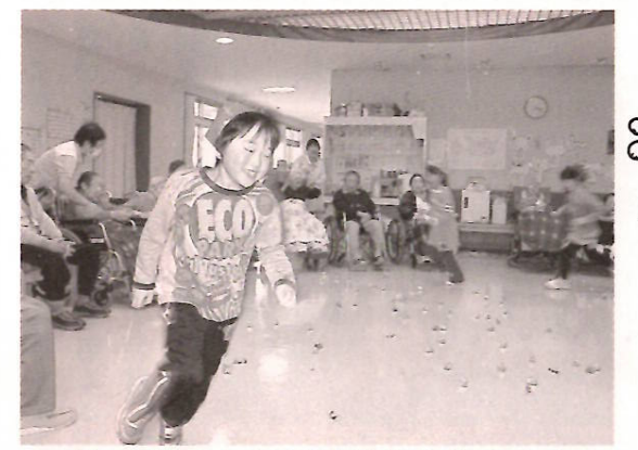
住民の輪の中を走り回る元気な鬼たち