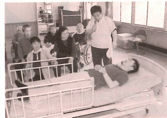
ベッドの機能性の高さを職員が体験

NTT東日本—岩手の皆さんのご厚意に改めて感謝申し上げます。いただいたベッドは末永く大切に利用させていただきます。