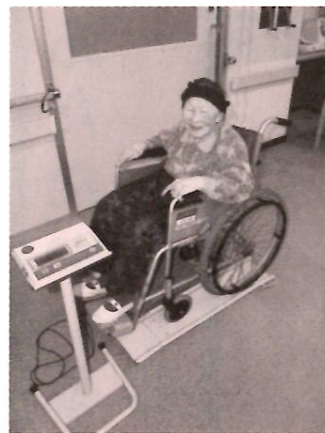
車イスに乗ったままでOK