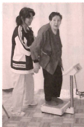
女性にとっては緊張の瞬間です