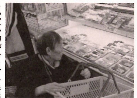
お買得品はどれかな？

さて、御所湖に到着しましたが、ここでも冷たい風が吹き、桜の花も虫にやられたのか過ぎたのかチラホラとさみしく残念なお花見でした。それでも公園の中を散策すると、小川で遊ぶ子供や大きな噴水に笑顔が見られました。そして、「買物さ行くべえ」との一声で、近くのJASストアへ移動することにしました。