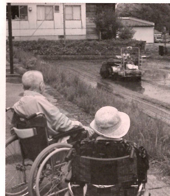
それにしても今の田植えはあつという間だなあ

店内に入ると、一番食べたかったところへ直行し、財布と相談しながら買い求めていました。漬物を買う人、果物やお菓子をもらう人それぞれ違います、その人らしい買い物ができ、一番楽しいひと時だったと思います。このように、外出し自然と触れ合うことにより気分転換になり、さまざまな思いが心を刺激してくれそうです。そして、それが明日からの活力になっていただければ幸いです。今後も住民の声を聞きながら、本人の希望をできるだけ叶えられるような支援をさせていただきます。この日は、住民にとっても私にとっても有意義な一日でした。